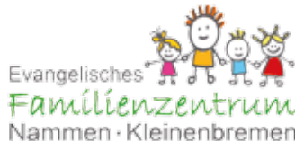
Evangelisches Familienzentrum Nammen · Kleinenbremen